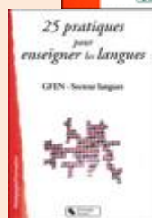
Secteur Langues du GFEN, 25 pratiques pour enseigner les langues , 2010