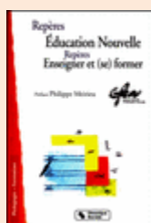
Secteur Langues du GFEN, Repères pour une Éducation Nouvelle - Enseigner et (se) former , 2001