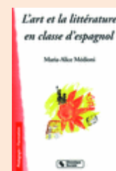
Maria-Alice Médioni, L'art et la littérature en classe d'espagnol , 2005