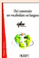
Secteur Langues du GFEN, (Se) construire un vocabulaire en langues , 2002