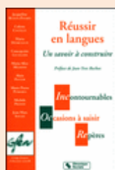
Secteur Langues du GFEN, Réussir en langues - Un savoir à construire , 1999, 2 e édition, 2002, 3 e édition, 2010